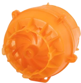
xABS-HT-Orange – vysoká teplotní odolnost