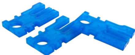
xGPP-Blue – nejrychlejší tisk funkčních prototypů