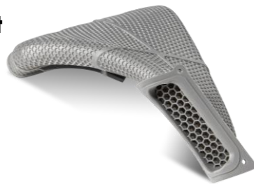
xGPP-Gray – přesnost v kvalitě vstřikování